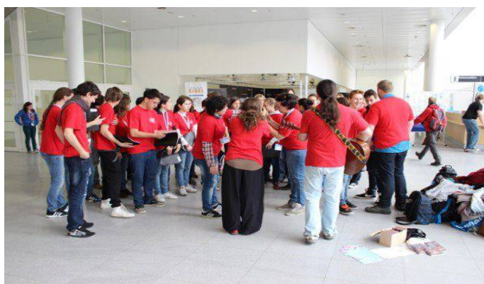
Il coro si prepara. Hamburg 2013

Lo scorso anno, giugno 2013, il nostro Coro ha partecipato al festival della Bibbia che si tiene a Vicenza. Il Coro ha cantato per le strade in alcuni punti prestabiliti davanti a un pubblico incuriosito e poi interessato. L'occasione è stata buona per far conoscere il Liceo valdese e il suo progetto di aprire un biennio di Bac internazionale riconosciuto dall'IBO di Ginevra.