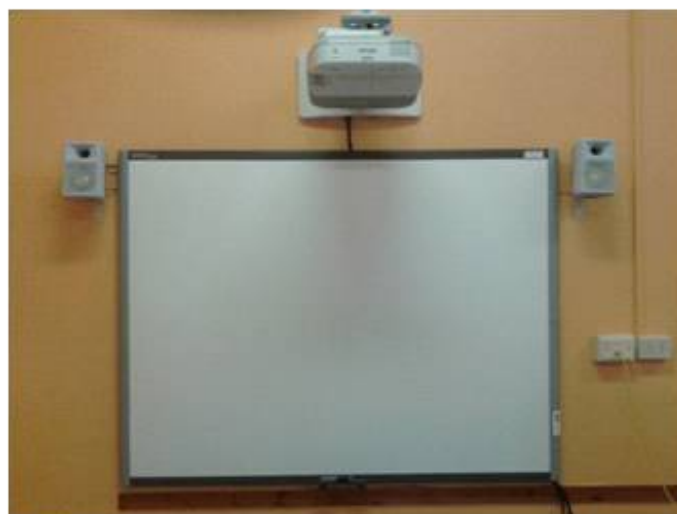
Una LIM (Lavagna Interattiva Multimediale)

Le LIM sono ancora strumenti costosi e vengono acquistati senza il pc portatile. Ora ci mancano 2 pc portatili che abbiano caratteristiche di potenza adeguate alle LIM. SE ne trovano di economici per questo ci bastano 1.000 Euro. Chi è interessato a donare per questi pc?