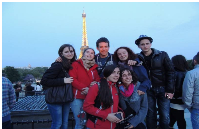
Il terzo anno a Parigi

Per questo offriamo loro la possibilità di fare