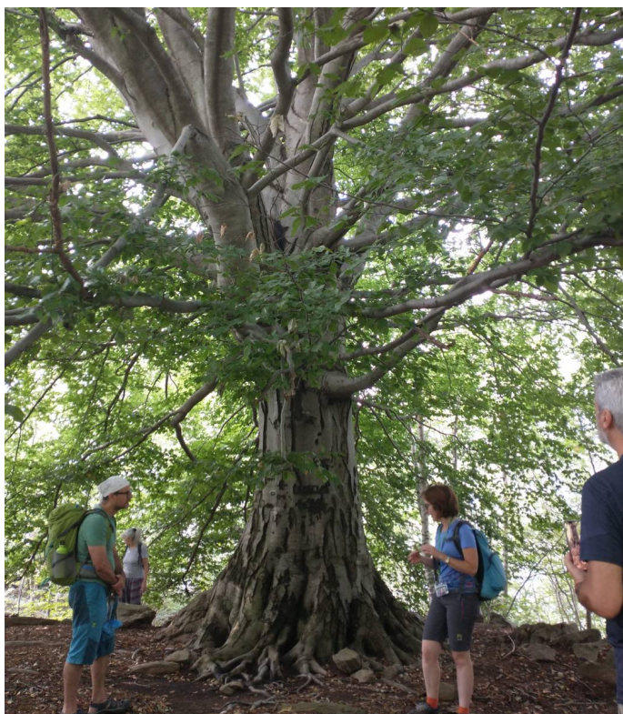
escursione sul tema "i grandi alberi" (faggio monumentale, Angrogna)

Venerdì 26 agosto alle ore 21 presso la galleria Scropo di Torre Pellice si è tenuta la conferenza tematica a cui ha partecipato una cinquantina di persone, che ha illustrato come si diventa grandi alberi e quali sono le caratteristiche prese in considerazione per definire queste specie arboree “monumentali”. Dall’elenco regionale degli alberi monumentali si sono poi evidenziati gli esemplari che possiamo ammirare sul nostro territorio ed infine si è dettagliato come vengono protetti e cosa possiamo fare per segnalare alla Regione nuovi giganti arborei da classificare.